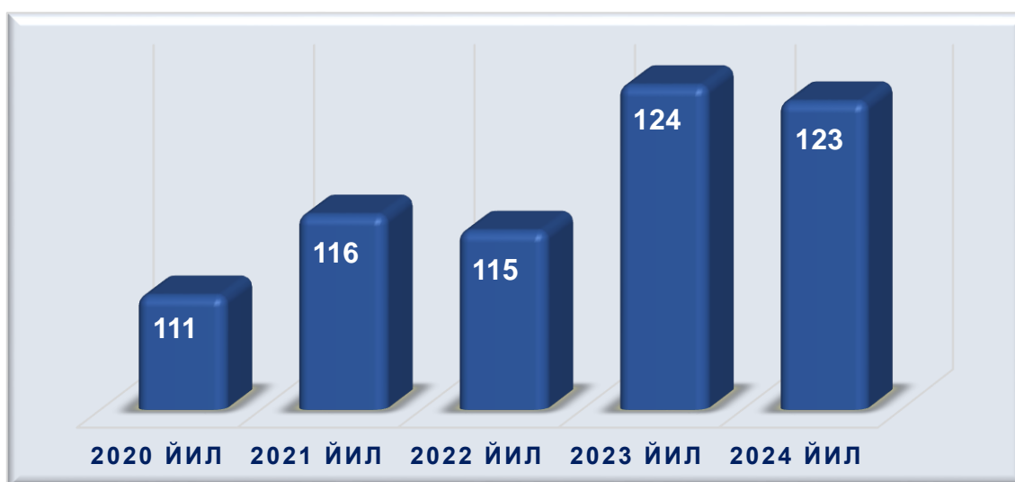
Расм. 2020-2024 йилларда кўриб чиқилган мурожаатлар сони динамикаси

2024 йил якунига кўра, «Ориент Финанс» ХАТБга турли алоқа каналлари орқали жами 123 та мурожаатлар келиб тушди ва улар девонхонадан рўйхатдан ўтказилди. Шу жумладан, электрон шаклда 113 та (92%) ва ёзма шаклда 10 та (8%) мурожаатлар келиб тушган. Мурожаатларнинг 99 таси (80%) жисмоний шахслардан ва 24 таси (20%) эса юридик шахслардан келиб тушган. Турлари бўйича 104 та (85%) ариза ва 19 та (15%) шикоятдан иборат бўлди (2022 йилга нисбатан жисмоний ва юридик шахсларнинг мурожаатлари сони 2023 йилда 1 тага кам бўлди).